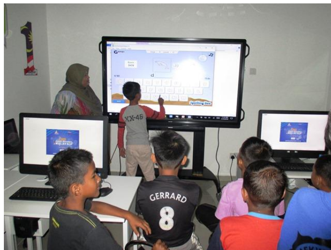
Seorang pelajar bermain permainan Bahasa Inggeris sambil diperhatikan dan dibantu pelajar lain.