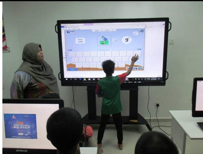
Pelajar bermain permainan Bahasa Inggeris.