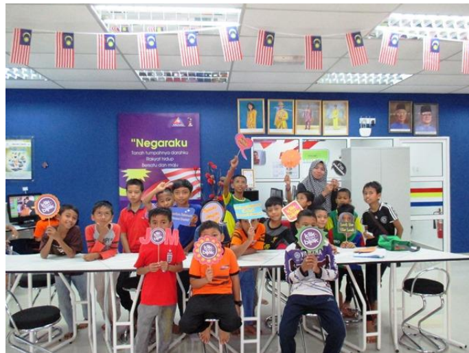
Bergambar bersama setelah selesai program.