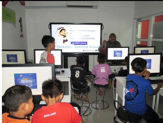
Sesi soal jawab Klik Dengan Bijak.